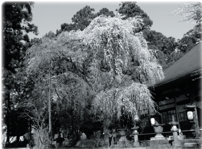
金剛寺の見事な垂れ桜（昨年）

苗ヶ島町では毎年恒例の桜まつりを開催いたします。多くの皆様のご来場をお待ちしております。