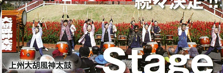
上州大胡風神太鼓