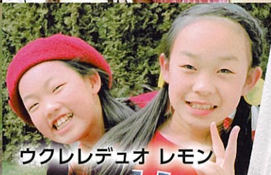
ウクレデュオ レモン